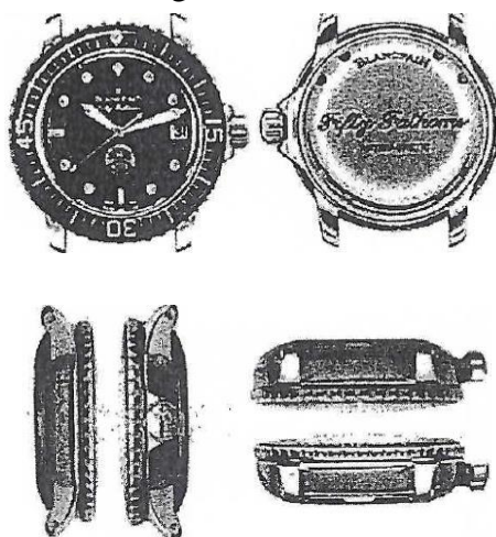
Registo de desenho nº DM/073974 (“Desenho comparativo 1”)